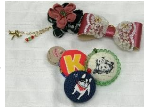
製作したパーツの一部↑

11月24,25日にル・シーニュ 5.6階で開催される市民協働まつりで販売する商品を製作中です。布製品を作るために、着物をほどくところから作業し、布や革を使って、キーホルダー・バックチャームを作っています。